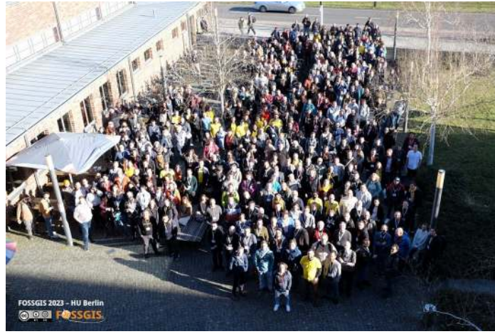
Gruppenfoto FOSSGIS 2023 in Berlin