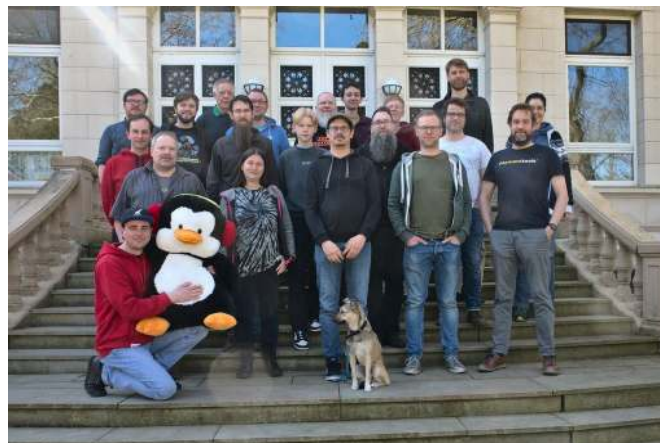
Aktiventreffen 2023 im Linuxhotel