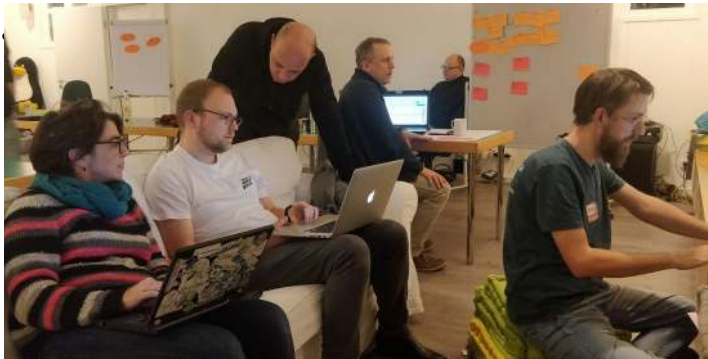
Aktiventreffen 2018 im Linuxhotel