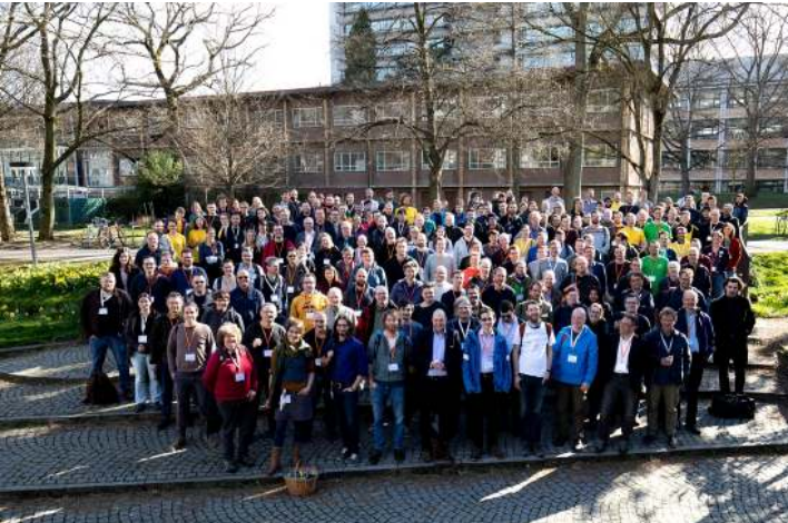
Gruppenfoto FOSSGIS 2020 in Freiburg